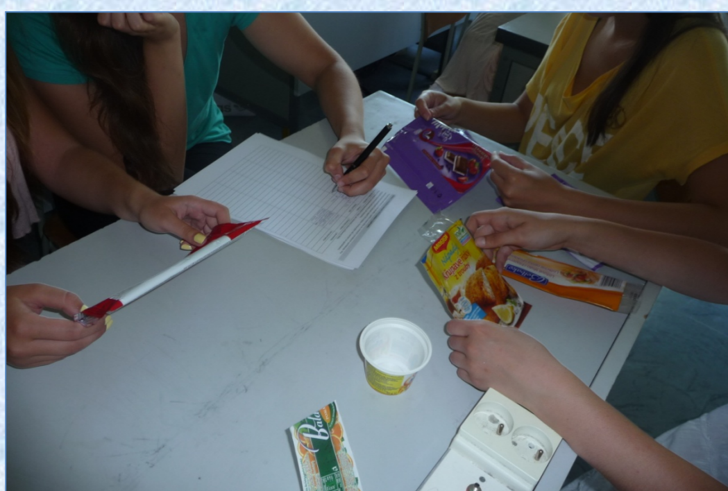
Obrázky: Výsledky skúmania