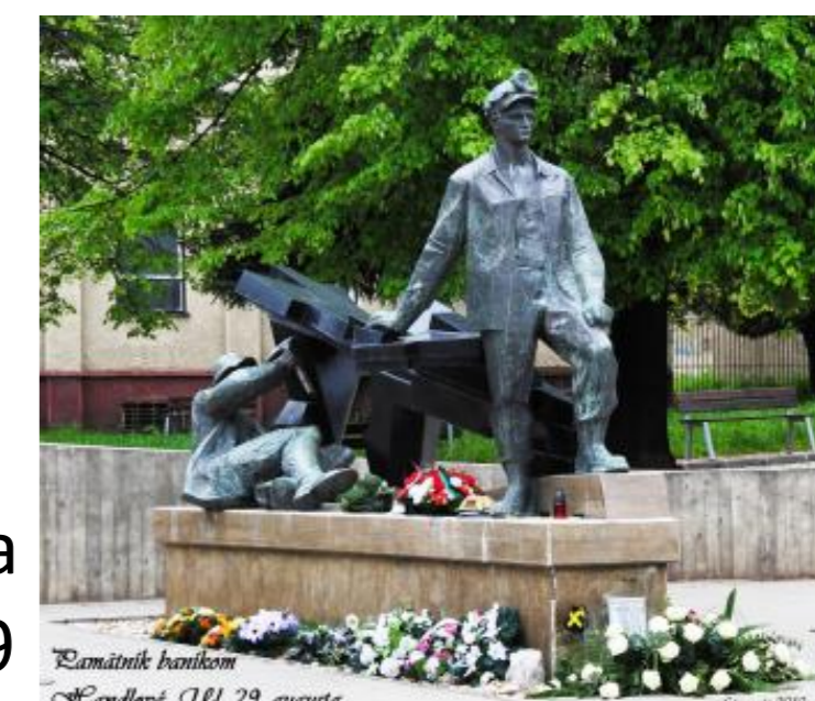
Pamätník banského nešťastia z 10.8. 2009 48°43'32,97"š 18°45'22,07"v

Vytvárali vlastné fotografie objektov, zameriavali ich GPS súradnice.